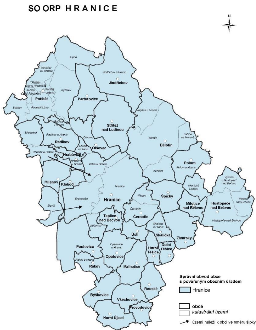
Mapka č. 1: SO ORP Hranice

garantují jisté pracovní místo po ukončení studia. Tento model se v podniku velmi osvědčil a je možné ho použít jako příklad dobré praxe při spolupráci SŠ a hlavních zaměstnavatelů v regionu. Je potřeba se však s propagací a prezentací technických oborů dostat až na základní školy. Zde je ten klíčový moment, který mnohdy ovlivňuje zaměstnání na další dlouhá léta.