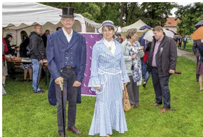
Odpoledne se neslo v duchu 200. výročí narození Boženy Němcové a 210. výročí narození Karla Hynka Máchy.