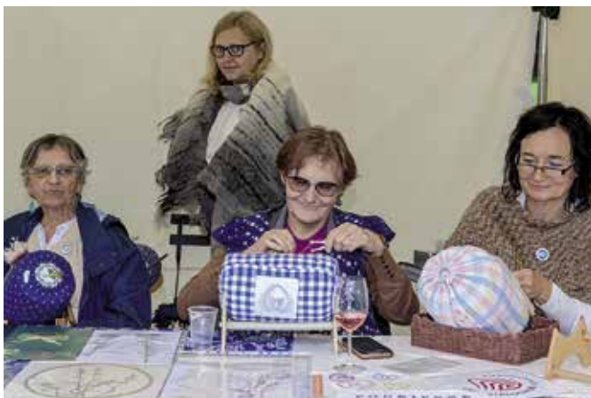
Jako za dob Boženy Němcové, na slavnostním zahájení jste si mohli prohlédnout i stánky s tradičními řemesly.