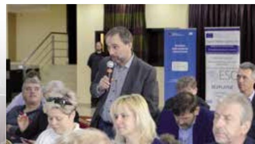
Ilustrační snímky z krajských setkání 2019