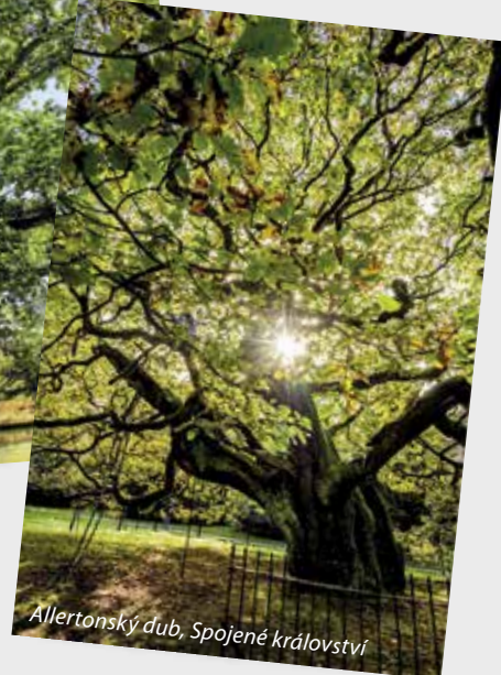
Allertonský dub, Spojené království