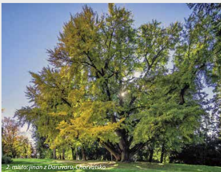
2. místo: jinan z Daruvaru, Chorvatsko