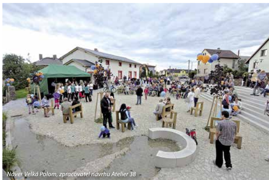
Návěs Velká Polom, zpracovatel návrhu Atelier 38

ty, které se týkají veřejných prostranství, je to, že vám mohou přinést další podněty ke zlepšení života v obci.