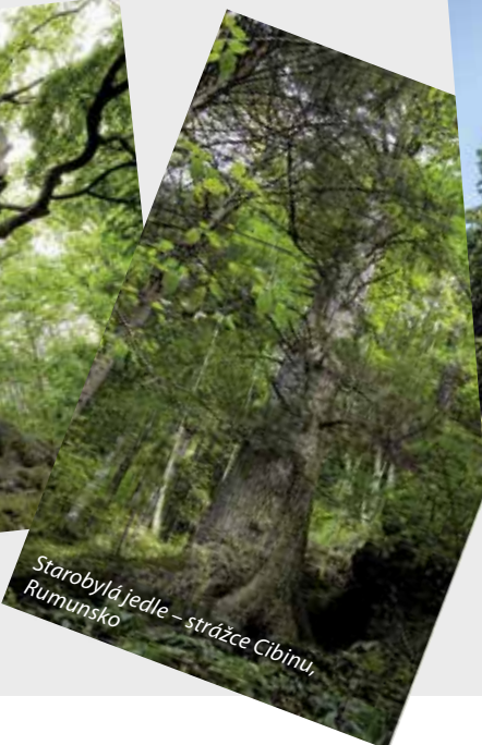
Starobylá jedle – strážce Cibinu, Rumunsko