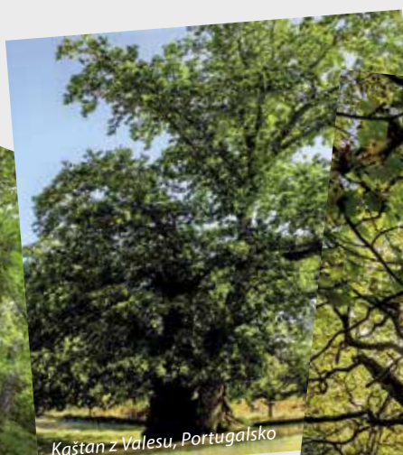
Kaštan z Valesu, Portugalsko