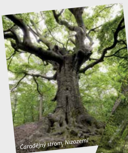
Čarodějny strom, Nizozemí