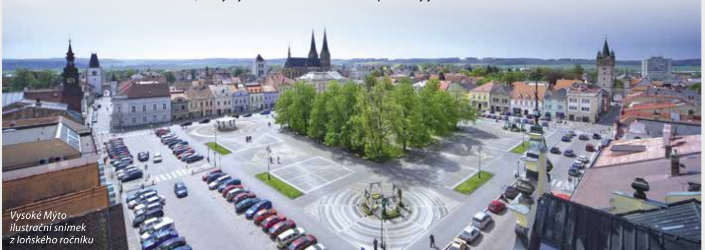
Vysoké Mýto – ilustrační snímek z loňského ročníku