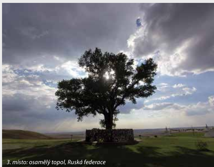
3. místo: osamělý topol, Ruská federace