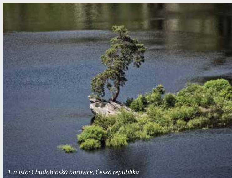
1. místo: Chudobínská borovice, Česká republika