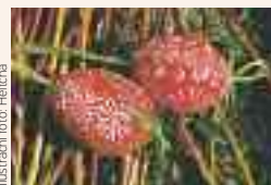
Ilustrační foto: Helicha

k vidění výstava Velikonoční kraslice Lenky Volkové a členů Asociace malířů a malířek kraslic České republiky.