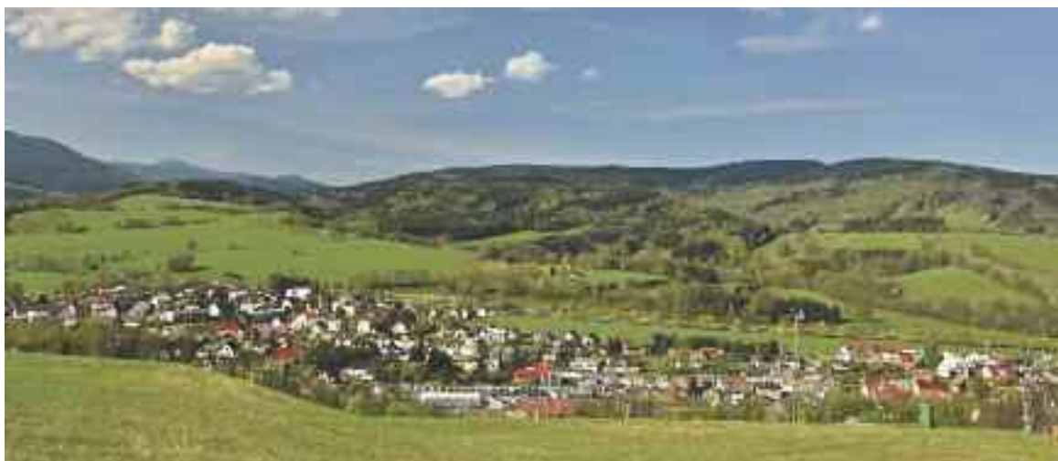
Městys Mladé Buky leží v podhůří Krkonoš