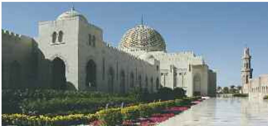
Součástí sultánova paláce je krásná mešita

Za prozkoumání určitě stojí i ománská města,