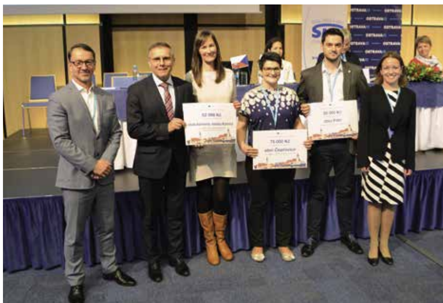
Vítězové soutěže byli vyhlášeni při příležitosti XVII. sněmu Svazu.

Finanční příspěvek, který vítězové obdrželi, je určen na uspořádání obecní slavnosti a all-inclusive pracovní cestu do Bruselu. Vítězům gratulujeme a soutěžícím obcím děkujeme za účast, bylo to těžké rozhodování. Do příštího ročníku soutěže se může přihlásit jakákoliv obec, která si neodnesla výhru v tomto.