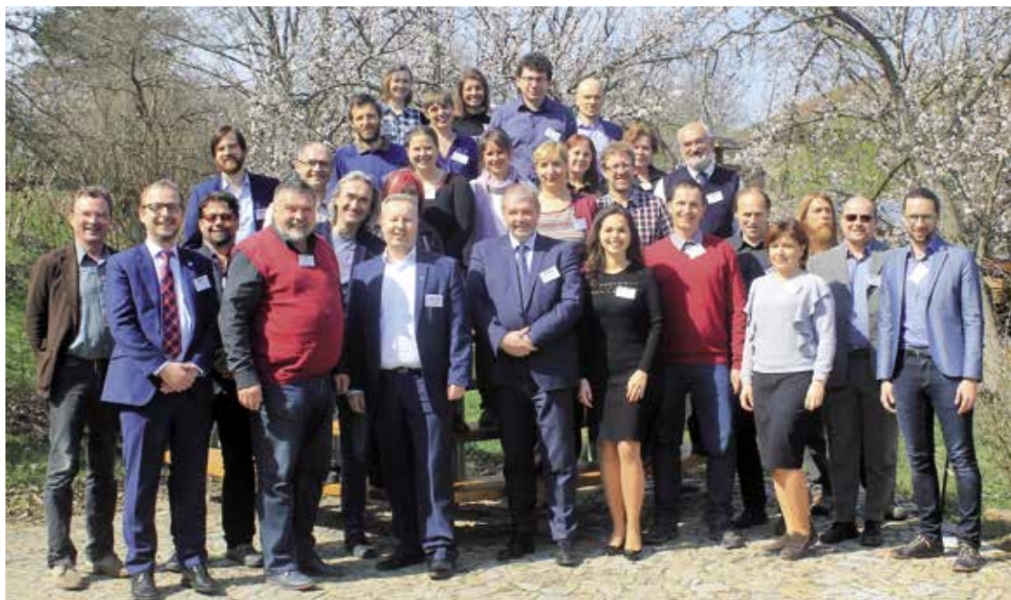
Třicet organizací spolu s ministrem Richardem Brabcem v Otevřené zahradě.

Iniciativa se rozběhne na podzim letošního roku a navazuje na úspěšnou loňskou kampaň Stromy svobody 1918–2018,