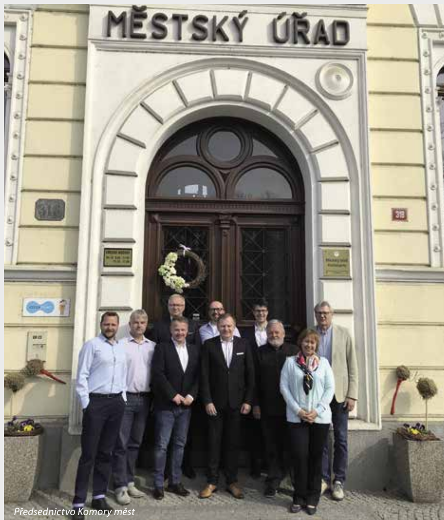
Předsednictvo Komory měst

kteří ke dni jednání čítá 2 754 obcí s více jak 8,4 mil. obyvateli. Detailně bylo projednáváno hospodaření Svazu k 31. prosinci 2018. Svaz v roce 2018 hospodařil s přebytkem hospodaření ve výši 3,5 mil. Kč, v něm je však zahrnut průběžný přebytek projektu CSS ve výši 3,8 mil. Kč, který bude čerpán v následujících obdobích. Schodek hospodaření bez zapojení výše uvedeného tedy činí 335 098,86 Kč. Mezi podstatné oblasti úspor ovlivňující hospodaření v roce 2018 patří náklady spojené se zahájením projektu ESO uvolněné z rezervního fondu, které byly kromě projektové žádosti uplatněny jako způsobilé náklady projektu. Dále pak nárůst členské základny, úsporná opatření v rámci roku nebo příspěvek na činnost pobočného spolku, který byl celý vrácen. Diskuse byla vedena i nad přípravou XVII. sněmu Svazu. Hodnocena byla únorová Právní konference, v příštím roce by se měla konat za obdobných podmínek jako v roce 2019, tedy ve spolupráci s advokátní kanceláří KVB. V závěru zasedání byli členové Předsednictva Svazu seznámeni se stavem realizace projektů Svazu a aktuálně projednávanou legislativou.