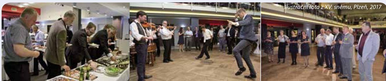
Ilustrační foto z XV. sněmu, Plzeň, 2017