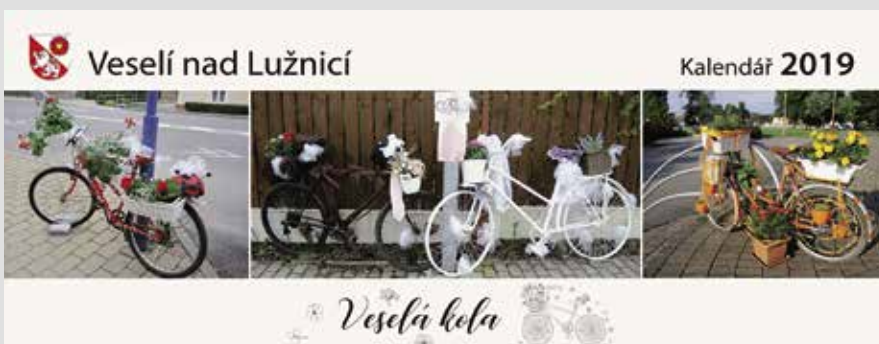
Veselí nad Lužnicí

V rámci 26. ročníku mezinárodního veletrhu reklamy, polygrafie, obalů a inovativních technologií, který probíhal ve dnech 9. až 11. dubna 2019 v PVA EXPO PRAHA v Letňanech, proběhla i výstava Kalendář 2019, v rámci které vyvrcholil mj. 19. ročník soutěže Kalendář obce 2019. Dne 9. dubna 2019 byl slavnostně vyhlášen vítěz této soutěže, jímž se stalo Veselí nad Lužnicí s kalendářem Veselá kola. Příběh vzniku tohoto kalendáře je vskutku zajímavým. V roce 2018 vyhlásilo Infocentrum města první ročník soutěže „O nejhezčí Veselé kolo“. Její iniciátoři si kladli za cíl zapojit místní občany