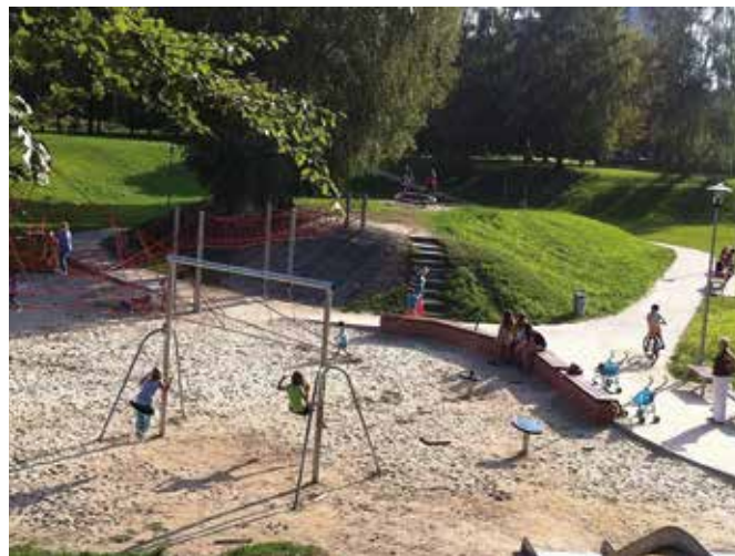
Regenerace sídliště Ostrava – Fifejdy I – sídliště, kde to žije...!!!