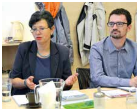
Kulatý stůl – Pardubice

Pracovníci Center se občas potýkají s nezájmem starostů o CSS a jejich činnosti. Proč by měli spolupracovat s CSS? „ Starostové zejména menších obcí tak mají volnější ruce pro vlastní práci a zároveň dostávají k dispozici smysluplná efektivní a výhodně ekonomická řešení například pro odpadové hospodářství, vodohospodářství, sociální