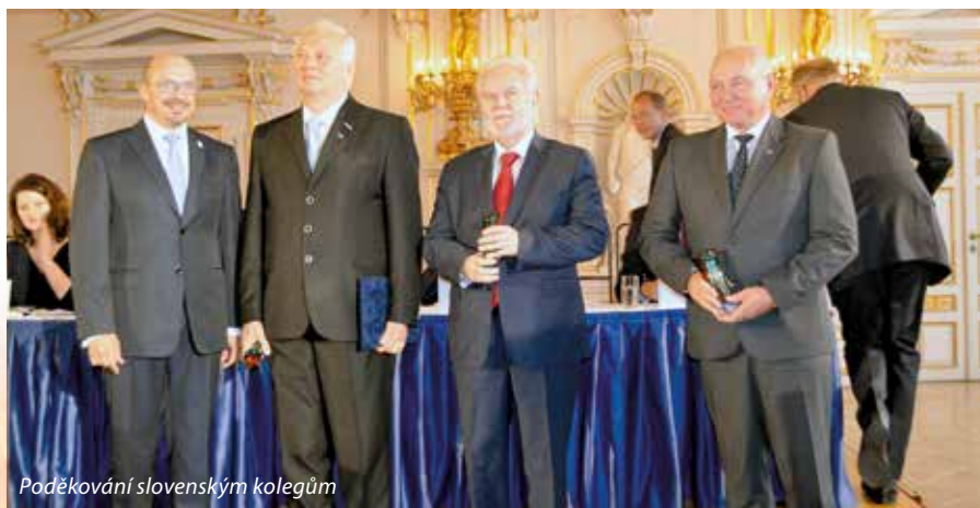
Poděkování slovenským kolegům

Ivan Bartoš , předseda Pirátské strany a předseda poslaneckého výboru pro veřejnou správu a regionální rozvoj, konstatoval, že i když je tato strana benjamínkem v Poslanecké sněmovně, funguje už devět let a vůči městům a obcím byla vždy otevřenou platformou. Tak funguje, a bylo tomu vždy, i poslanecký výbor pro veřejnou správu. Právě při jeho jednáních se setkávají poslanci, ministři, náměstci ministrů a zástupci samosprávy, aby společně řešili