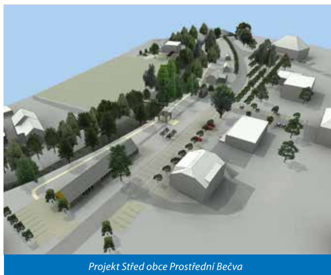
Projekt Střed obce Prostřední Bečva