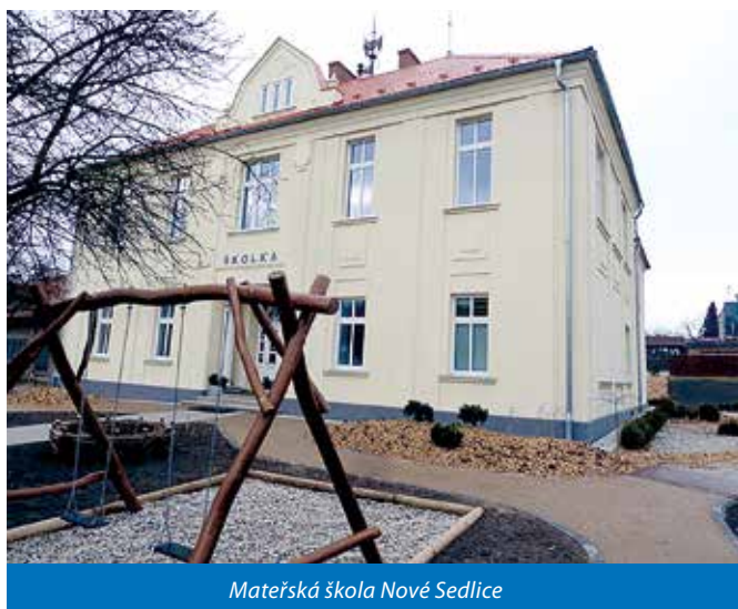
Mateřská škola Nové Sedlice