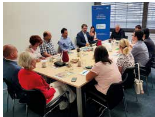
Kulatý stůl – Praha

V setkávání u kulatých stolů CSS budeme i nadále pokračovat. Pokud by vás nějaké téma zajímalo, ozvěte se nám na doleza-