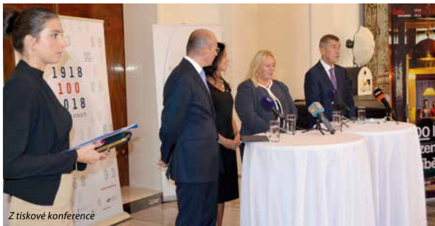
Z tiskové konference

V dalším programovém období společné zemědělské politiky bude možné přispět na rozvoj venkova z rezortu zemědělství předpokládanou částkou 3 až 3,5 mld. Kč. Upozornil, že začátkem října bude u nich otevřeno téma obslužnost venkova, konkrétně pak bude snaha podpořit pojiždné prodejny, produkci místních produktů, místní trhy atd. Důležitá je ale i infrastruktura v obcích. Proto rozhodl o postupném bezúplatném převádění pozemků pod komunikacemi či chodníky z majetku ministerstva zemědělství na města a obce, aniž by se musela dělat pasportizace. Vše by mělo být ve velmi krátké době zadministrováno. Závěrem zmínil, že letos si připomínáme 10 let od vzniku Celostátní sítě pro venkov, která pokrývá celé území státu a zahrnuje stovky partnerů z veřejné správy, neziskových organizací, soukromých podnikatelů a dalších aktérů, které společnou komunikací přispívají k jeho rozvoji.