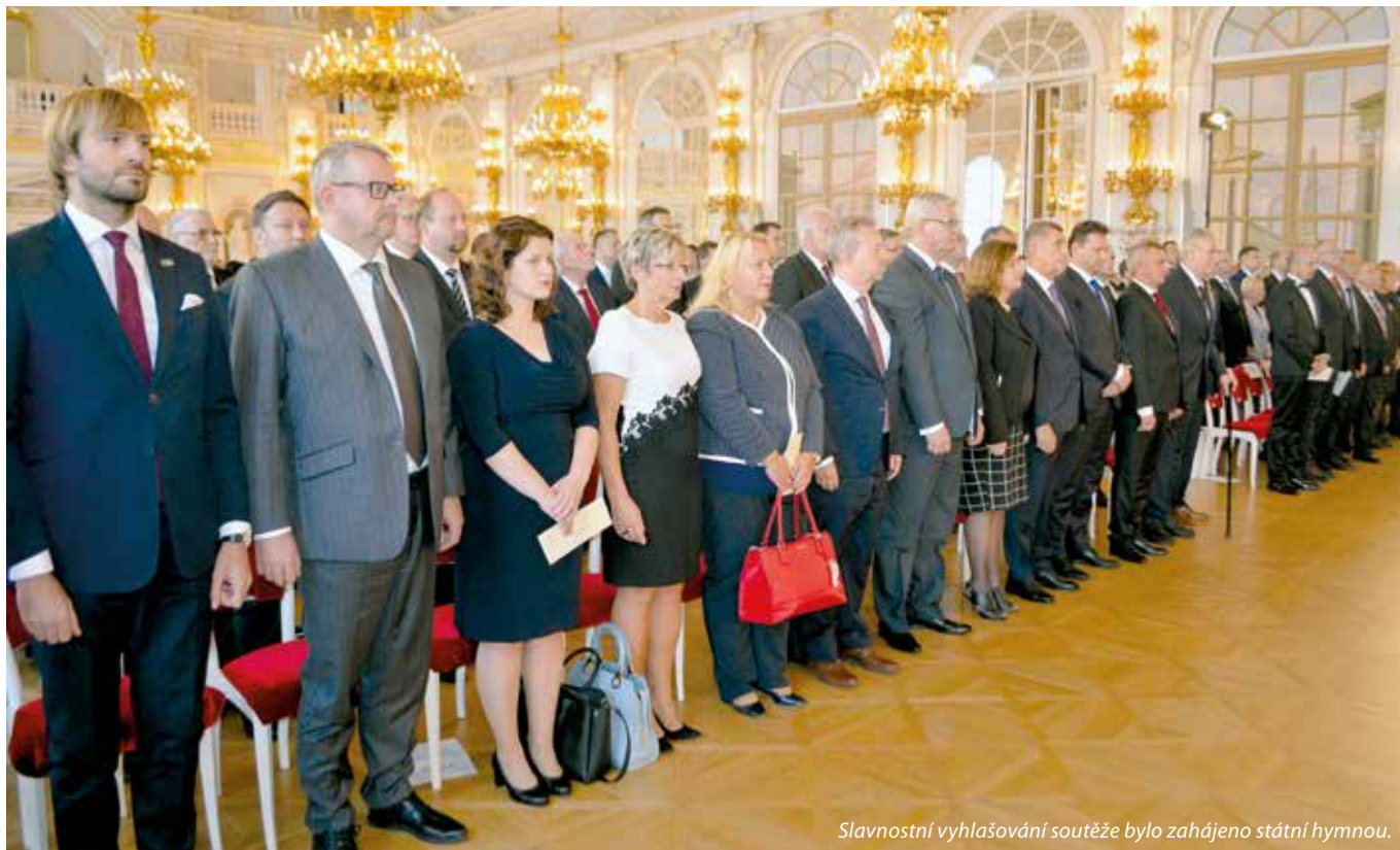
Slavnostní vyhlášení soutěže bylo zahájeno státní hymnou.

Pro začátek uvedme pár čísel. Letos se do soutěže přihlásilo 172 starostů a starostek. Nejstaršímu soutěžícímu bylo 80 let a tomu nejmladšímu 29. Za zmínku stojí i to, že 12 soutěžících svoji funkci vykonává od roku 1990, to je úctyhodné.