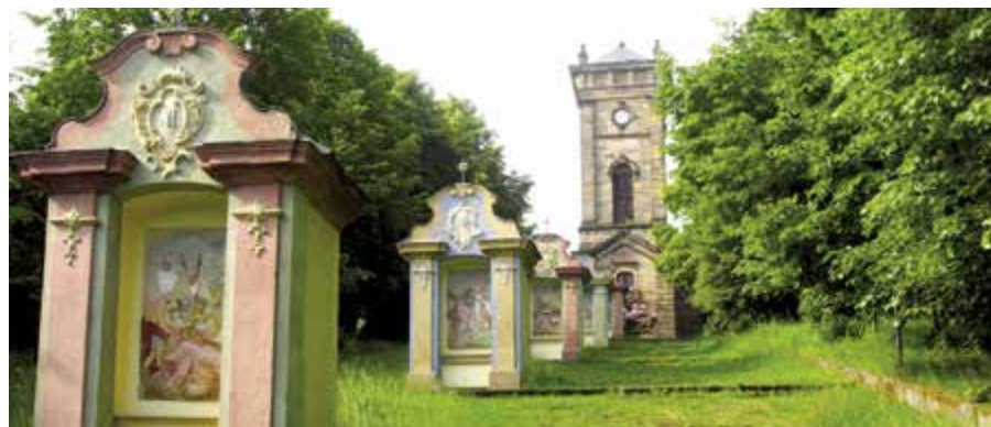
V majetku obce je i Křížová cesta. Obec za její dlouhodobou obnovu obdržela v letošním roce v celostátní soutěži pořádané Svazem historických měst a sídel ČR hlavní cenu v kategorii malá Památka roku 2017.

nekoncepční řešení. Možná by uvedené zvládly MAS, které mají nejbližší a tím i hodně objektivní přehled o dění v obcích a potřebách místně příslušných regionů. Hlavně na této úrovni, zde dole, jsme schopni spolu koncepčně jednat, i se někdy zdravě pohádat, a to většinou ku prospěchu dané oblasti. Uvedené nezvládnou žádná ministerstva, kraje ani kanceláře zmocněnce vlády. Rád bych v této souvislosti upozornil na některé problémy související s financemi na podporu cestovního ruchu včetně různých volnočasových rekonstrukcí sloužících jak turistům, tak místním občanům, na které nesmíme při této debatě též zapomenout.