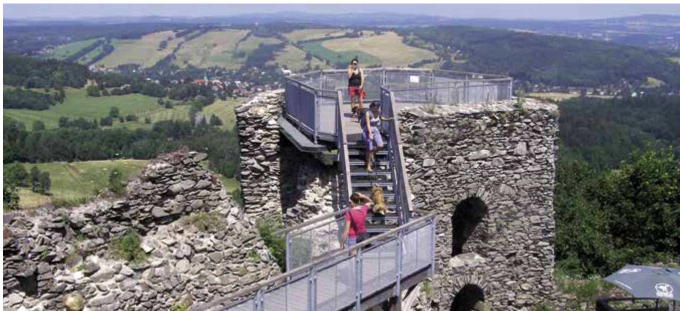
Zřícenina hradu Tolštejn, v pozadí Jiřetín pod Jedlovou. Na novou vyhlídku postavenou na bývalé hladomorně obci přispěl kraj. Výstavba vyhlídky významně zvedla návštěvnost, která již třetím rokem činí kolem 40 tisíc návštěvníků za rok.

Již téměř rok nás ministerstva financí a místního rozvoje střídavě informují o způsobech, kterými by chtěla v obecních rozpočtech zvýšit objem financí do rozvoje cestovního ruchu. Ten je dlouhodobě podfinancován, a to i v letech, kdy příjmy do státního rozpočtu z tohoto odvětví stále stoupají.