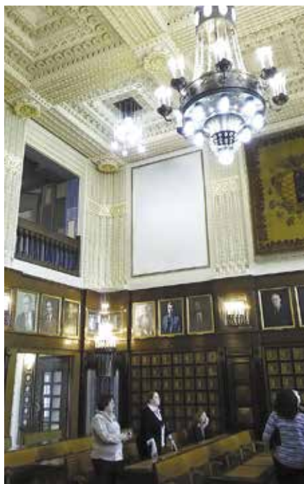
Členové Školské komise měli možnost obdivovat krásy prostějovské radnice.

Dalšími body jednání komise pak byly připravované legislativní změny, které vyplývají z novely školského zákona, a informace o dohodovacím řízení v jednotlivých krajích ohledně zajištění překrývání dvou učitelek na 2,5 hodiny a 24 žáků. U většiny krajů problém není, ale jsou kraje, kde je financování stále nastaveno špatně. Na závěr komise projednala společnou účast na semináři k venkovskému školství v Senátu 6. června 2017 a rozhodla, že po ukončení semináře bude v odpoledních hodinách pokračovat řádné zasedání Školské komise.