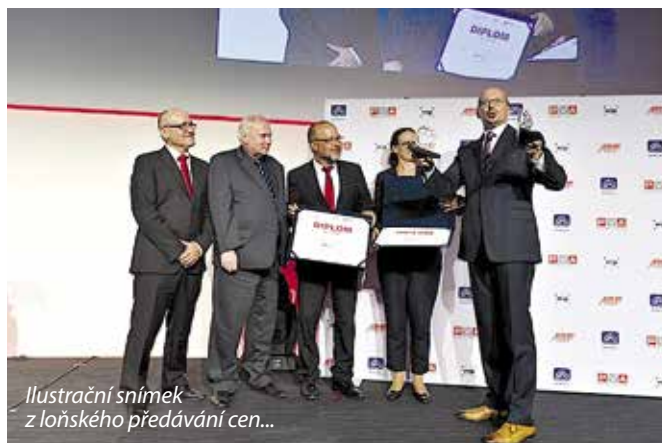
Ilustrační snímek z loňského předávání cen...

Více informací naleznete na internetovém odkazu: bit.ly/Architekt_obci2017 .