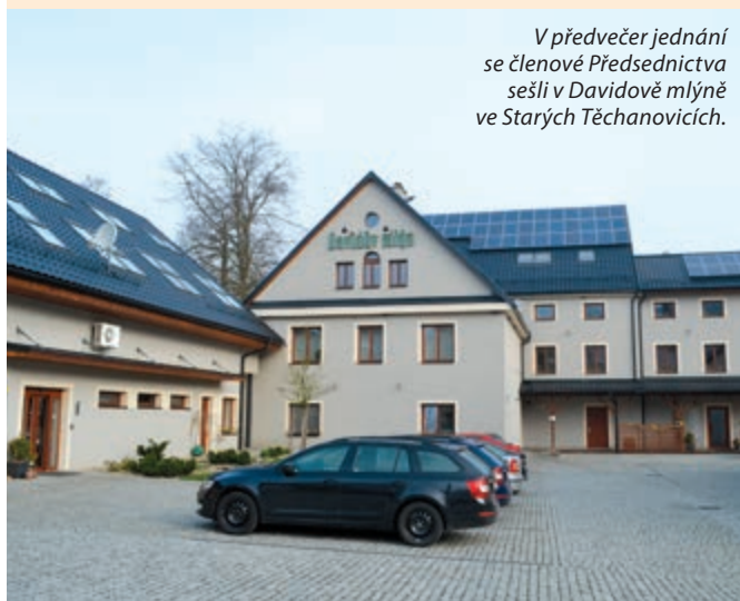
V předvečer jednání se členové Předsednictva sešli v Davidově mlýně ve Starých Těchanovicích.