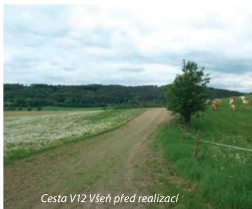
Cesta V12 Všeň před realizací