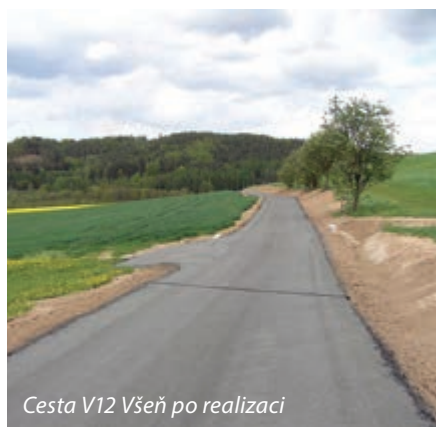
Cesta V12 Všeň po realizaci