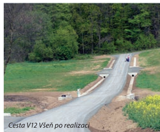
Cesta V12 Všeň po realizaci