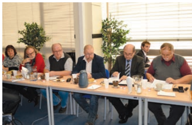
sedání Rady Svazu – viz str. 5, 6 a přítomní si vyslechli také informace z vybraných svazových jednání – viz aktuality INS č. 12/2015.

Ve třetí části zasedání byly projednány podkladové materiály na za-