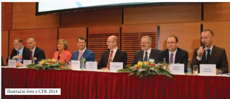
Ilustrační foto z CFK 2014

Přípravy na XVIII. ročník celostátní finanční konference vrcholí. A přestože do jejího zahájení zbývá ještě pár týdnů, již dnes ( k datu uzávěrky INS č. 11 ) evidujeme přes 300 přihlášených účastníků! Takový zájem jistě svědčí o tom, že se jedná nejen o hodnotnou akci po stránce odborné, ale