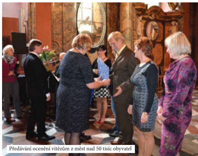
Předávání ocenění vítězům z měst nad 50 tisíc obyvatel

Soutěž o nejlepší městskou knihovnu vyhlašuje Svaz knihovníků a informačních pracovníků ČR, tentokrát již po šesté. Záštitu nad touto soutěží převzal Svaz měst a obcí ČR. I jejím cílem je ocenit nejlepší české knihovny, v tomto případě z těch větších měst, a motivovat je k rozšíření a zkvalitnění veřejných knihovnických a informačních služeb. Letos bylo přihlášeno 39 městských knihoven.