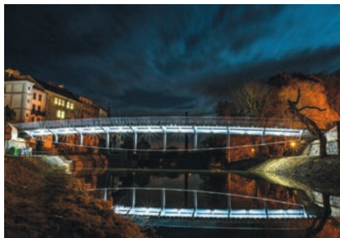
Jednou z vítězných staveb je i Komenského most v Jaroměři (fota ostatních vítězných staveb jste mohli vidět již v INS č. 8-9 a 10/2015, kde byly zveřejněny dílčí zprávy z průběhu soutěže).

Na slavnostním večeru v pražské Betlémské kapli byli rovněž vyhlášeni vítězové Zahraniční stavby roku 2015 a Urbanistického projektu roku 2015. Letošní titul Zahraniční stavba roku získala stavba AGC Glass Building v Belgii. V kategorii Urbanistický projekt roku 2015 proměnil nominaci na vítěze Územní plán města Sušice. Cena veřejnosti patří AIR House, který navrhl a postavil tým studentů z ČVUT v Praze.