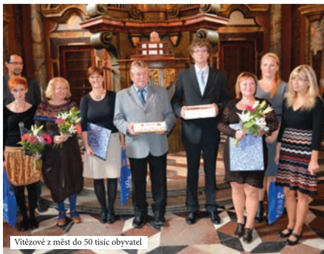
Vítězové z měst do 50 tisíc obyvatel