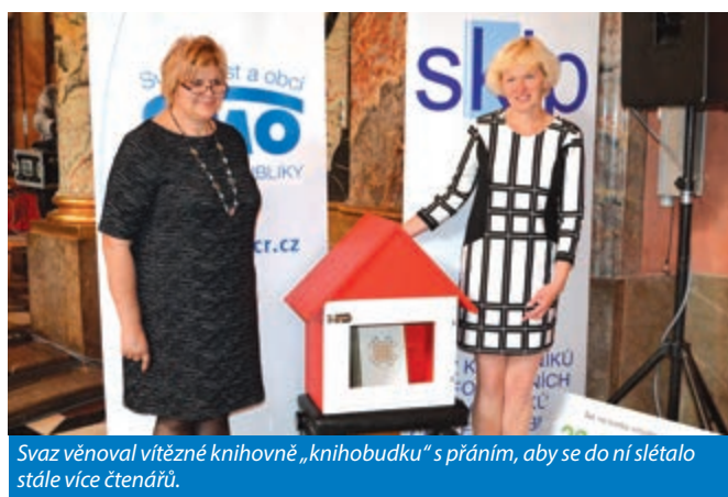
Svaz věnoval vítězné knihovně „knihobudku“ s přáním, aby se do ní slétalo stále více čtenářů.

Tyto knihovny byly ve druhém kole navštíveny a hodnoceny odbornou komisí. Předmětem hodnocení na místě bylo především společenské a komunitní působení knihovny pro obyvatele města a úroveň prostředí knihovny, dále exteriér, interiér, technické vybavení, sociální zázemí apod. A víte, kolik čtenářů má vítězná knihovna v Olomouci? 6561 a knihovní fond čítá úctyhodných 251 129 knihovních jednotek.