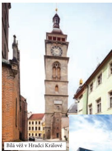
Bílá věž v Hradci Králové

měst a obcí. Z jeho pohledu je samozřejmě povzbudivé, že mezi 15 nejlepších se dostaly stavby, jejichž investory byla města. Patří k nim např. rekonstrukce Bílé věže v Hradci Králové, Trojský most v Praze, dostavba základní školy v Dobřichovicích, Komenského most v Jaroměři nebo podzemní komplex v severní části Staroměstského náměstí v Mladé Boleslavi. Na slavnostním večeru byly rovněž oznámeny nominace na titul Urbanistický projekt roku 2015. Zde zabodoval také projekt regenerace sídliště Ostrava-Fifejdy I, jehož investorem je statutární město Ostrava spolu s městským obvodem Mariánské Hory a Hulváky. Finálový večer soutěže proběhne 13. října 2015 v prostorách pražské Betlémské kaple.