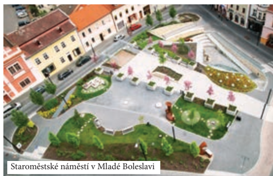
Staroměstské náměstí v Mladé Boleslavi