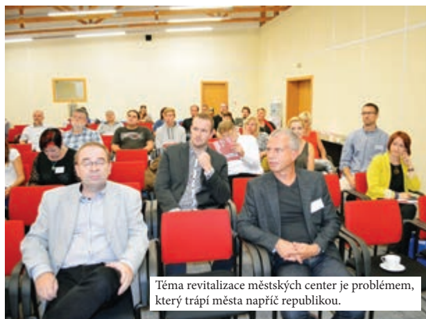
Téma revitalizace městských center je problémem, který trápí města napříč republikou.