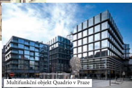
Multifunkční objekt Quadrio v Praze