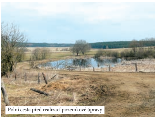
Polní cesta před realizací pozemkové úpravy

pozemkového úřadu, na některých obecních úřadech). Je však možné požádat i formou jednoduché vlastní žádosti. Žádost je nutné podat na příslušnou pobočku Státního pozemkového úřadu. Zahájit řízení lze však i z jiných důvodů, shledá-li Státní pozemkový úřad opodstatněné důvody, naléhavost a účelnost provedení pozemkových úprav.