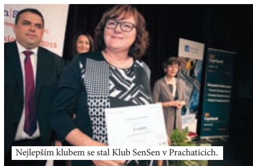
Nejlepším klubem se stal Klub SenSen v Prachaticích.