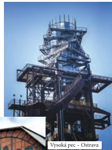
Vysoká pec – Ostrava