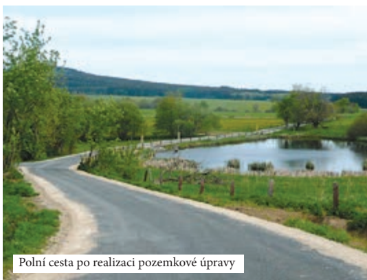
Polní cesta po realizaci pozemkové úpravy

k zemědělství. Komplexní pozemkové úpravy představují komplexní řešení zpravidla celého katastrálního území (mimo zastavěné území) včetně zpřístupnění pozemků, protierozní ochrany, vodohospodářských opatření a ekologické stability území.