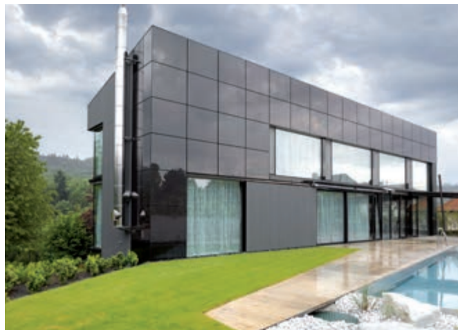
V soutěži Stavba roku 2014 bylo oceněno 5 staveb, mj. jeden rodinný dům a Letecké muzeum Metoděje Vlacha v Mladé Boleslavi.

Kromě rekordního počtu přihlášek, jsou dalším velkým úspěchem letošního ročníku soutěže také celkové proinvestované náklady přihlášených staveb. Ty činí 42 miliard, což je podle výsledků průzkumu Nadace pro rozvoj architektury a stavitelství 10% veškerých prostavených finančních prostředků v České republice za rok. Přihlášky pro letošní ročník byly otevřeny od dubna do začátku června. Šanci na ocenění nejprestižnější soutěže českého stavebnictví mají stavby nové i rekonstruované, urbanistické realizace veřejného prostoru, úpravy krajiny, bytové i nebytové budovy, dopravní a inženýrské stavby i zcela specifická stavební díla. Titul Stavba roku bude porota opět udělovat pěti stavbám, a to bez rozlišení pořadí a kategorií.