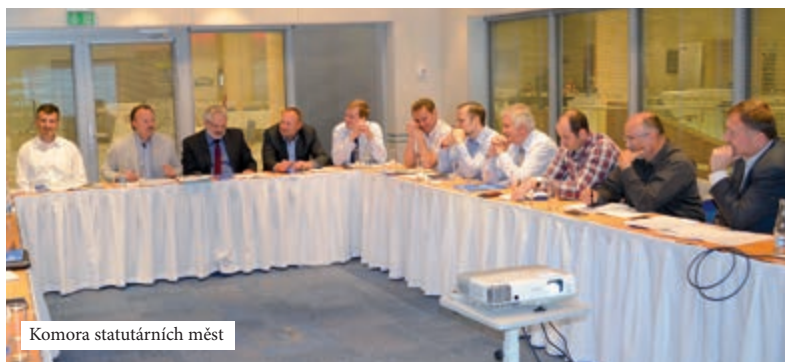
Komora statutárních měst