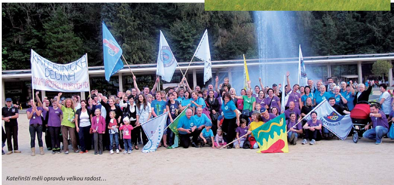
Kateřinští měli opravdu velkou radost...