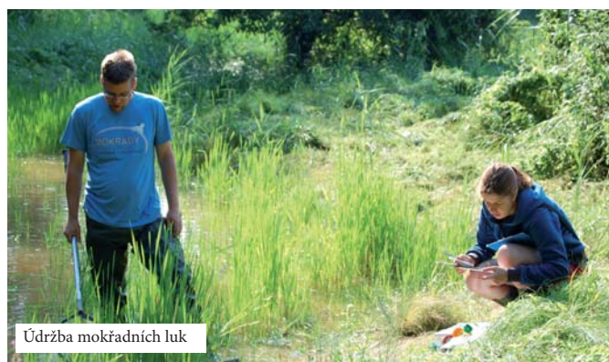
Údržba mokřadních luk