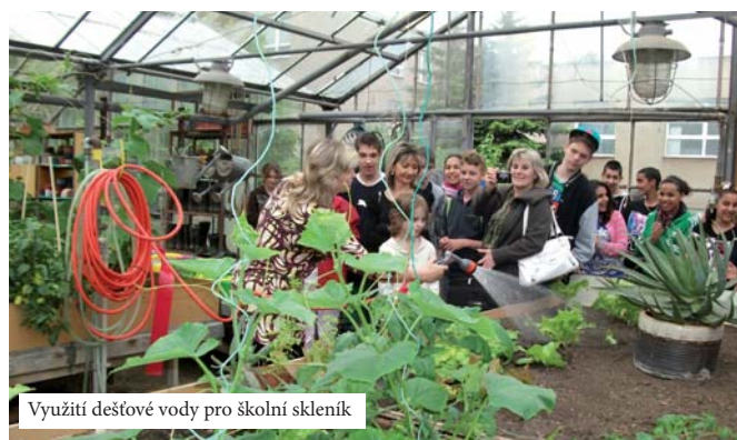
Využití dešťové vody pro školní skleník