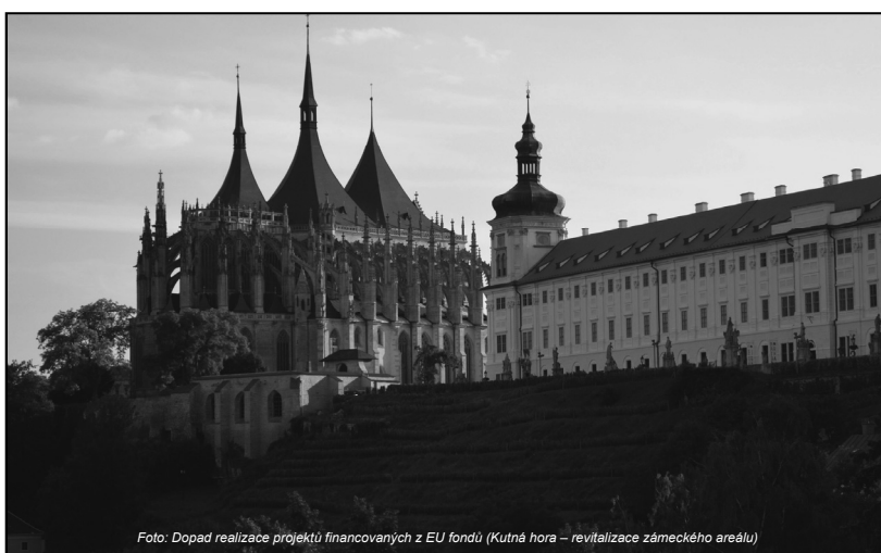
Foto: Dopad realizace projektů financovaných z EU fondů (Kutná hora – revitalizace zámeckého areálu)