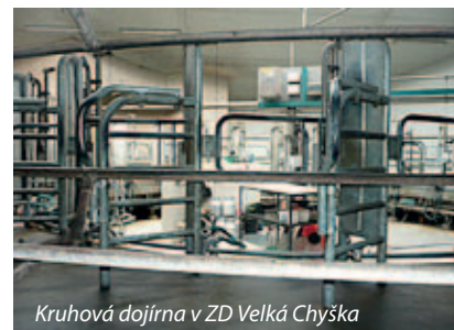
Kruhová dojrna v ZD Velká Chyška

s kruhovou dojárnou pro 24 dojnic a s jímkami na kejdu. Studenti si dále prohlédli také bramborárnu, kde se brambory skladují v 900 kg bednách. Poslední zastávkou byla společnost Selekta Pacov, a.s. Zdejší mléčná farma s kapacitou 270 ks dojnic využívá k získávání mléka dojící roboty Lely Astronaut. Farma se neustále rozšiřuje a modernizuje, z Programu rozvoje venkova se realizoval projekt „Stavební úpravy stáje a dojícího robota“ v rámci opatření I.1.1 Modernizace zemědělského podniku. V podnikové šlechtitelské stanici Hrádek účastníci viděli skleníky, kde se šlechtí nové odrůdy brambor.