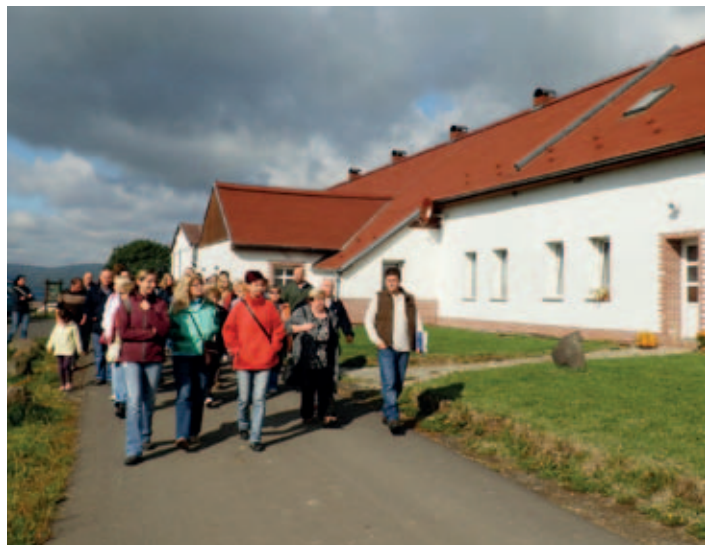
Prohlídka ranče v Lučním Chvojně