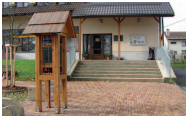
Informační centrum v obci Křižánky

Hospodaření v chráněné oblasti V roce 1970 byla na části okresu vyhlášena Chráněná krajinná oblast Žďárské vrchy , která zaujímá cca 19 tisíc ha zemědělsky obhospodařované půdy a především lesy v severní části okresu. Na území okresu jsou tři vodárenské nádrže a to Vír, který záso-