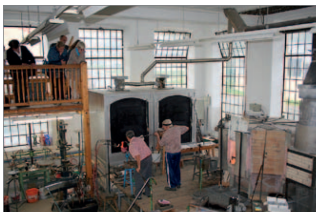
Z celé řady exkurzí přinášíme snímek z návštěvy sklárny v Nagelbergu (Workshop B)