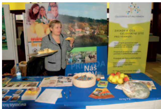
Společný stánek Kraje Vysočina, KAZV Jihlava a Celostátní sítě pro venkov