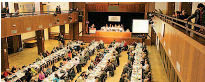
Pohled do sálu při slavnostním semináři „Brambory 2012“

Vlastní setkání pěstitelů, zpracovatelů i výzkumníků však zahájila odborná konference na téma „ Nová pravidla a zvyklosti obchodu s bramborami v Evropě, “ která se uskutečnila v Havlíčkově Brodě předchozí den. Hlavní