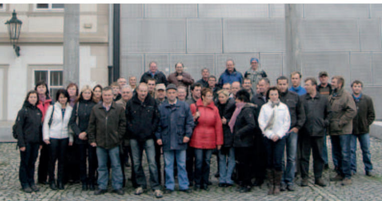
Účastníci před chmelařským muzeem v Žatci

Návštěva tří krajů umožnila partnerům Celostátní sítě pro venkov z trebičského okresu navázat mezi sebou bližší kontakty a vyměnit si vzájemné zkušenosti. Poznali řadu realizovaných projektů ve všech navštívených lokalitách a seznámili se s přístupy místních aktérů Sítě a s možnostmi čerpání podpory pro zemědělství a venkov.