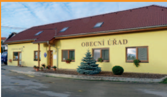
Nově opravená budova Obecního úřadu a vpravo rybník na návsi v Rudce