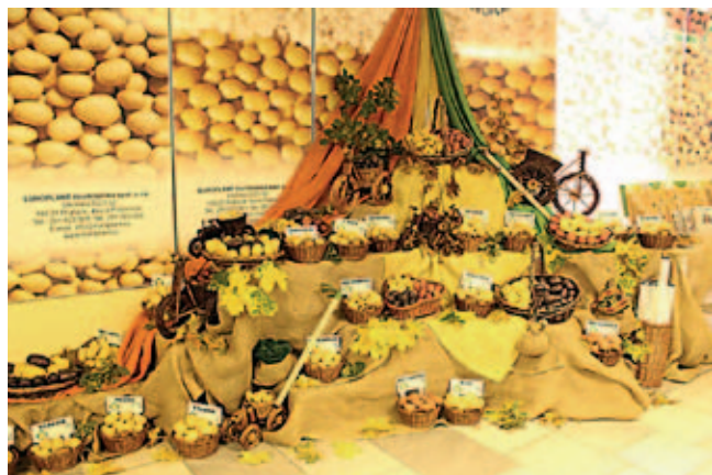
Prezentační stánek šlechtitelské společnosti EUROPLANT

Bramborářské dny v Havlíčkově Brodě mají svou tradici a jsou oblíbené i u místních obyvatel, kteří měli na Havlíčkově náměstí příležitost využít nabídku drobného prodeje konzumních a sadbových brambor, výrobků z brambor, ale také ovoce, zeleniny, květin, ryb a potřeb pro zemědělce a zahrádkáře. Bramborářské dny doplnila také soutěž ve škrábání brambor, výstava historických vozidel a vystoupení folklórních souborů.