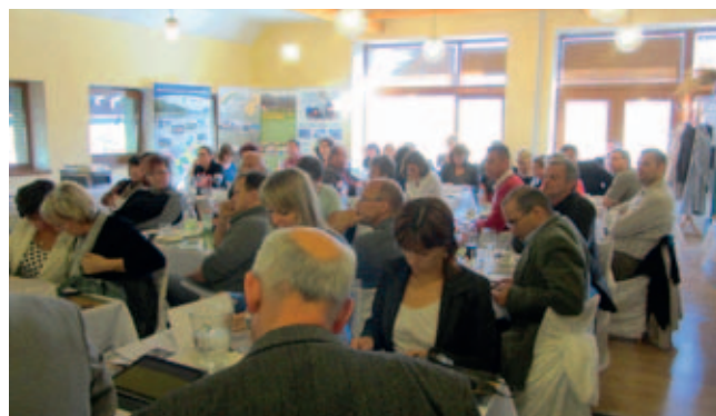
Pohled na účastníky semináře ze Zlínského a Olomouckého kraje