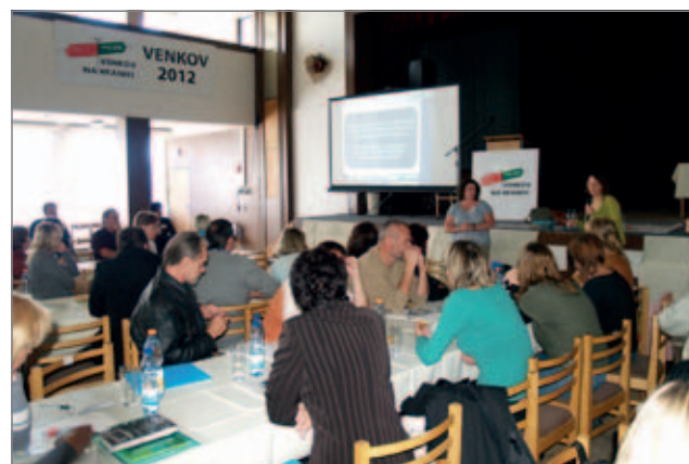
Jak na komunitní workshopy prakticky předvedly představitelky místní akční skupiny PLANED z Walesu