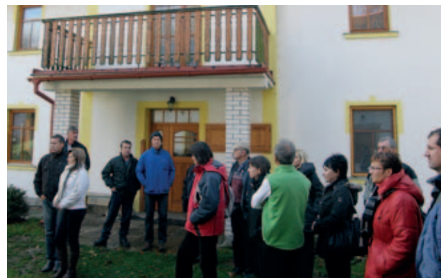
Dům jógy v Hlavici