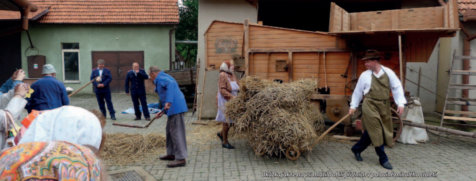
Ukázka jak se na vsi mlátilo obilí při žních v polovině minulého století.