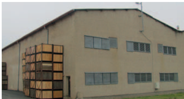
Budova bramborárny v Petrovčích

V závěru akce účastníci zhodnotili připravený program a průběh exkurze pozitivně, protože jim byla touto akcí nabídnuta možnost seznámit se se zajímavými realizovanými projekty a vyměnit si zkušenosti s realizátory těchto projektů. V průběhu setkání měli účastníci také možnost sdělit organizátorům akce své názory na dosavadní činnost CSV a předat jim náměty a tipy na aktivity pro rok 2013.