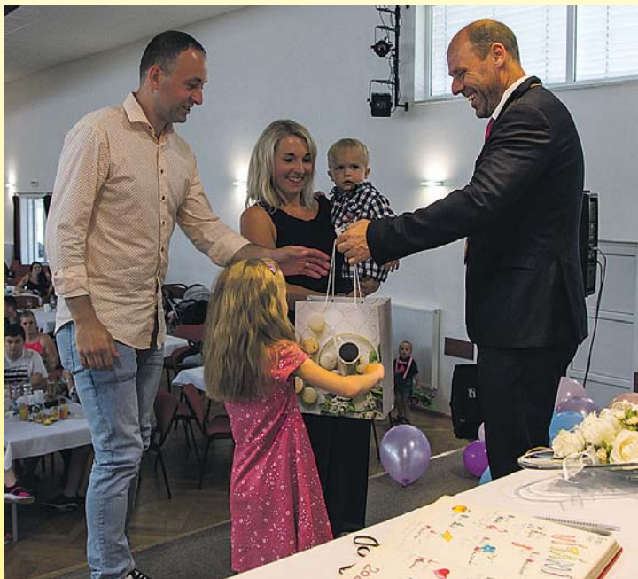
V Kolovči přivítali dvacet čtyři nových občánků.