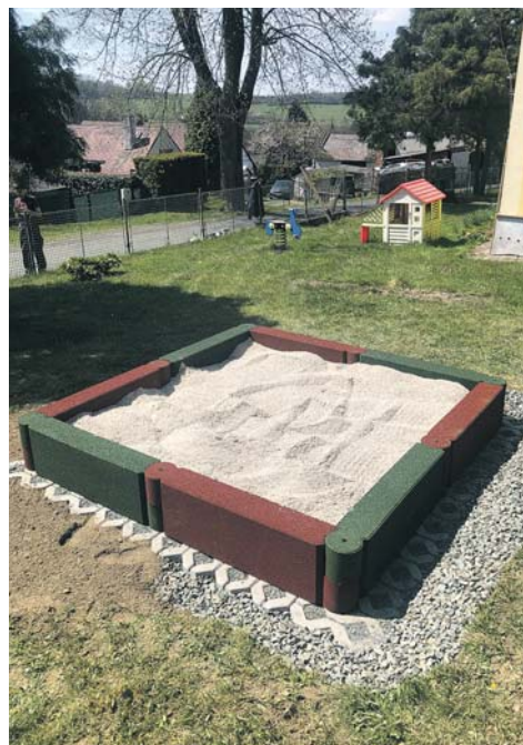
Nové pískoviště v MŠ Hluboká.