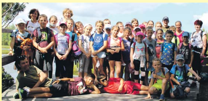
V červnu se vydali pocinovičtí školáci na tradiční týdenní pobyt v Nových Hutích na Šumavě. Navštívili i vlčí výběh na Srní, zdolali vrchol Blatenského lesa Klet, kde navštívili observatoř, na Kvildě zase jelení výběh a v Borové Ladě nejkrásnější Chalupskou slať. Nechyběla stopovačka, výlet za zmrzlinou na Churáňov a soutěže a hry u hotelu. ZŠ Pocinovice