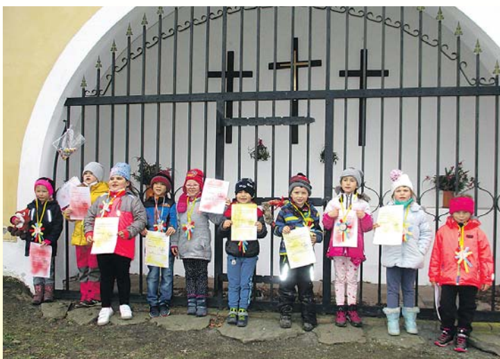
V obci Kout na Šumavě připravila učitelka mateřské školy tři turistické stopovačky po okolí obce pro rodiče s dětmi. Více str. 6