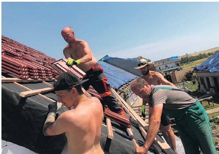
Starosta městyse Všeruby a dobrovolní hasiči ze Všerub a Nové Vsi pomáhali od 28. června do 4. července v nejpostiženějších oblastech jižní Moravy, v části obce Hrušky, v ulici Za Vodú a v Moravské Nové Vsi.

byla setkání s místními. Pan starosta mluvil například se starší paní, která litovala, že si tornádo nevzalo i ji. Zničený dům neměla ani pojištěný a chyběly jí i peníze na jeho opravu. Byla bezradná a nevěděla, co dělat. Sehnali jí základní materiál a pomohli. Podobných příběhů si dobrovolníci vyslechli v Moravské Nové Vsi, kam se později přesunuli, spoustu. Solidarita se projevovala rovněž mezi obyvateli, jichž se katastrofa přímo dotkla. „Například jeden pán nám řekl, že nás nechá u sebe samotné, protože na střechnu se bojí vylézt a půjde raději pomoc sousedovi s vyklizením nábytku. To, co mají obyvatelé postižené oblasti za sebou, je strašné. Když jsem kluky oslovil, neměl ni-