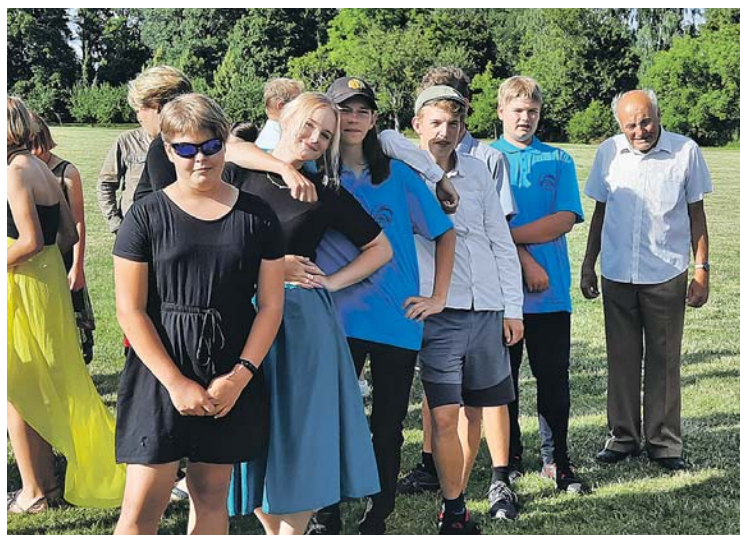
Kdyňský tým na Mistrovství ČR juniorů a žáků v rybolovné technice.

žákyně – disciplíny D1, D5, Vícemistryně ČR v kategorii žákyně – disciplína – 5boj, 2. Vícemistryně ČR v kategorii žákyně – disciplína D2 Změřit si své zkušenosti se závodníky z celého světa je výzva pro každého závodníka. Proto naši závodníci navštívili ve dnech 10.–11. července Nové Zámky na Slovensku, kde se konaly hned tři závody najednou – Slovak