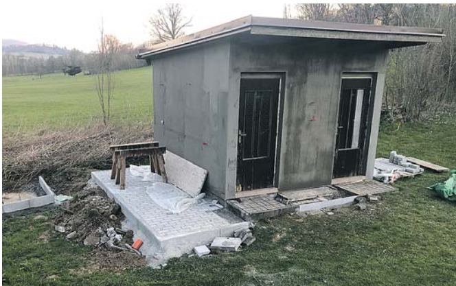
Toalety na koupališti ve Smržovicích.

Pro život ve spádových obcích je zajištění vyžití pro děti velice důležité, ačkoliv nikdy nemůže být tak pestré jako možnosti, které se dětem i jejich rodičům nabízejí ve městě, kde se nachází ví-